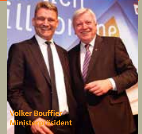
Volker Bouffier Ministerpräsident

Verein zur Wirtschaftsförderung im Fischbachtal, Vorsitzender Kultur- und Verschönerungsverein Lichtenberg, Vorsitzender Lichtenberger Musikstiftung Herfried Apel, Vorstandsmitglied Breuberg-Bund / Wissenschaftliche Erforschung des Odenwaldes Odenwaldklub Mitglied in vielen örtlichen Vereinen Bergbauernhilfe Südtirol