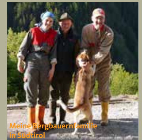
Meine Bergbauernfamilie in Südtirol