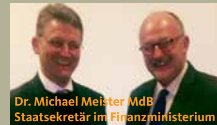
Dr. Michael Meister MdB Staatsekretär im Finanzministerium