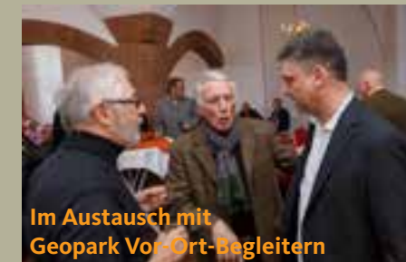
Im Austausch mit Geopark Vor-Ort-Begleitern

“Aktive Bürgergesellschaft” bei der Konrad-Adenauer-Stiftung Standortmarketing für Tourismus und Arbeitsplätze Arbeitsgruppe Weiterentwicklung Ländlicher Raum Mittelstandsvereinigung der CDU Kommunalpolitische Vereinigung (KPV) Gemeinsam mit meiner Frau unterstützen wir Menschen mit autistischen Störungen bei der Integration ins Berufsleben