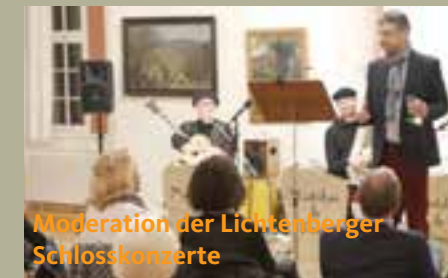
Moderation der Lichtenberger Schlosskonzerte