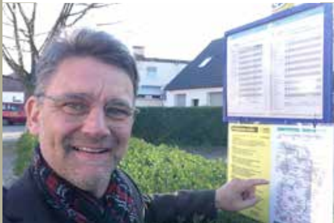
Bessere Busverbindung. Für Fischbachtal. Wir ergreifen Initiative gegen die Nachteile aus dem Fahrplanwechsel.