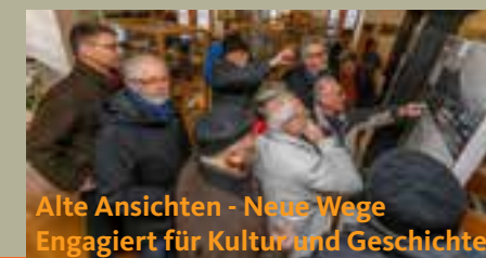
Alte Ansichten - Neue Wege Engagiert für Kultur und Geschichte