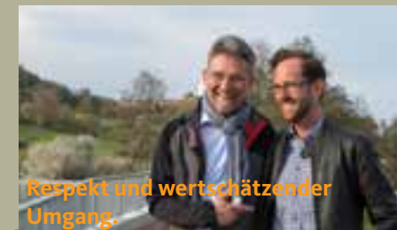
Respekt und wertschätzender Umgang.